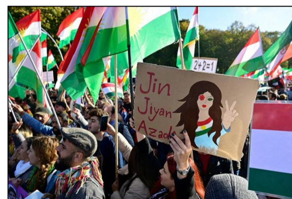
Le slogan " Jin, jîyan, azadî " (femme, vie, liberté en kurde) a atteint tous les coins du monde

Bien que les manifestations en Iran aient commencé à la fin de l'année, elles sont devenues l'un des principaux événements de 2022. Le développement de ces protestations sera également l'un des événements à suivre dans l'année à venir.