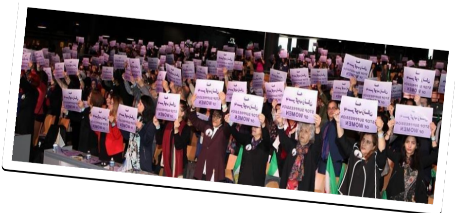
Les Femmes la Force du Changement : Conférence du 8 mars