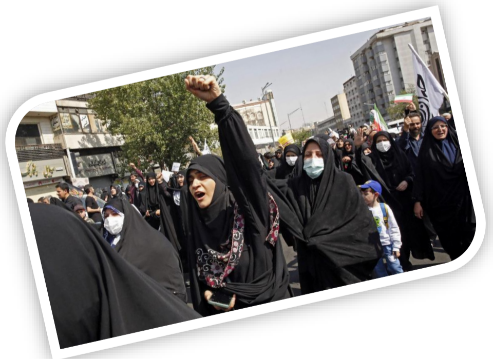
Le Soir.fr « Iran : l'âpre lutte des femmes depuis la révolution islamique »