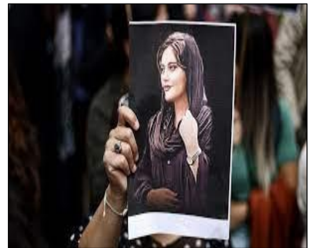
Photo des manifestantes portant le portrait de la jeune iranienne décédée.

Le 30 septembre 2022, plus de 66 personnes sont tuées. Ce jour est nommé le vendredi sanglant. Au vu des nombreuses manifestations et révoltes, le gouvernement dictatorial tente d'apaiser son pays en abolissant cette police des mœurs mais les iraniens attendent toujours du changement... 4