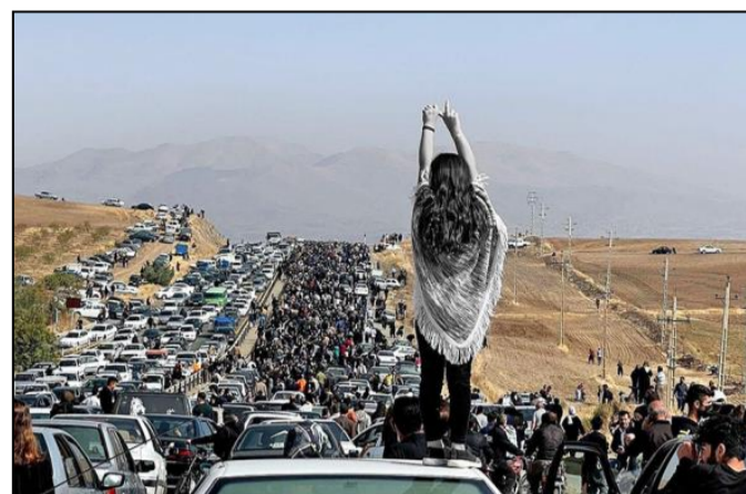
Les femmes iraniennes mènent les protestations avec un soutien important des hommes

Le rôle que jouent les femmes dans les manifestations est essentiel. Leur slogan " Jin, jîyan, azadî " (qui signifie en kurde "femme, vie, liberté") a atteint les quatre coins du monde, tandis que leur courage, leur bravoure et leur force ont inspiré des femmes dans des pays tout aussi oppressifs comme l'Afghanistan.